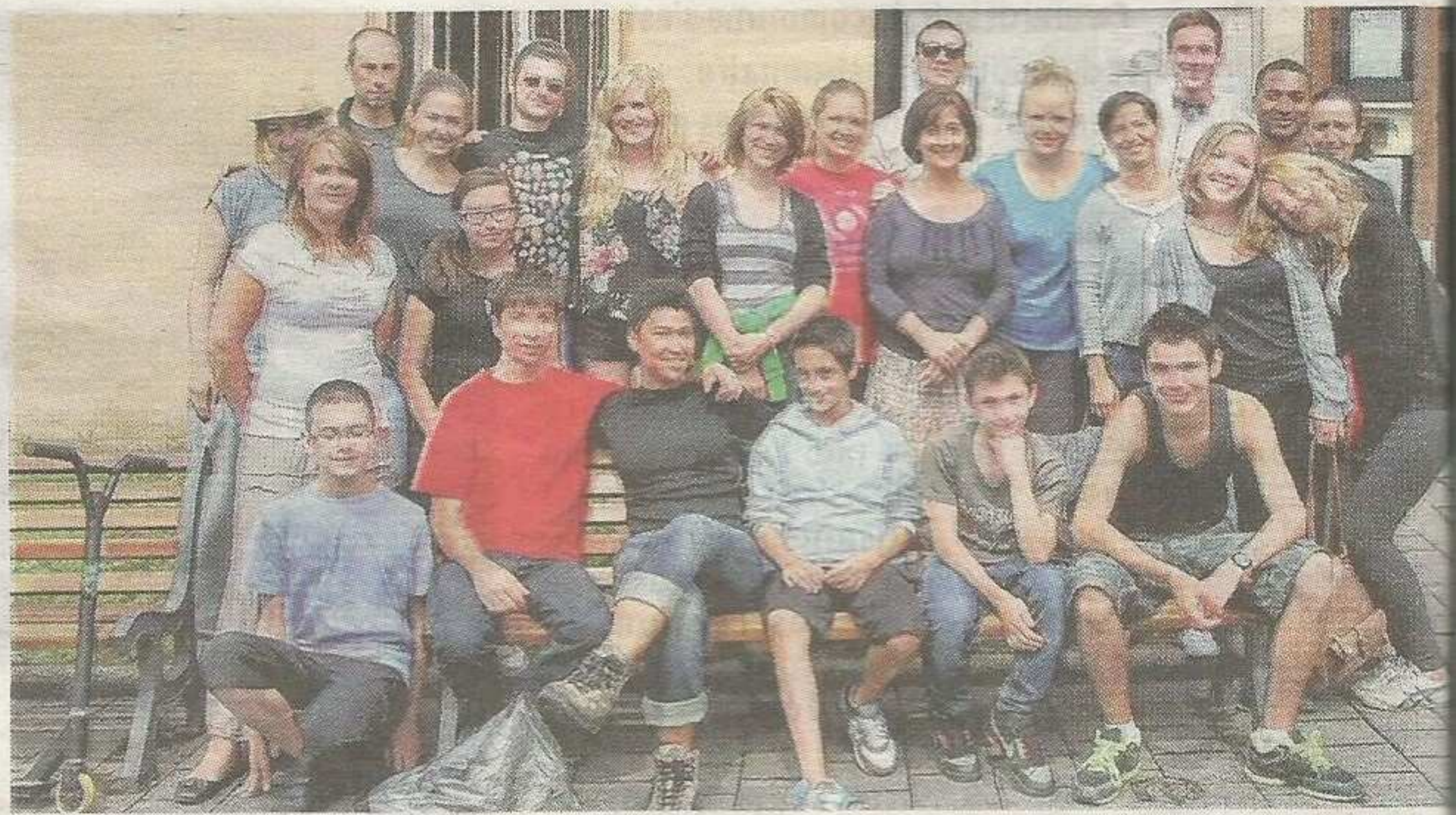
■ Après avoir repeint la salle de réunion et le hall de Cap génération, ou encore désherbé les rues du bourg, les douze jeunes vont bientôt travailler sur le Bois-d'Oingt.

réunion et le hall de CAP, désherbé les rues du bourg ou encore rangé du mobilier à l'école. L'après-midi, lui, est consacré aux visites. À l'image de ce mercredi, où ils étaient au vieux village, pour découvrir la chapelle romane. Le soir, la troupe rentre dormir, sous la tente, à Chessy, dans l'ancien camping municipal. Bientôt, ils iront faire de la peinture au Bois-d'Oingt. La jeune encadrante est la Roumaine Denisa Roman (actuellement à Sciences Po et Iframond, Lyon 3), qui met sa fougue au service de ses camarades. Tous sont à ce jour heureux