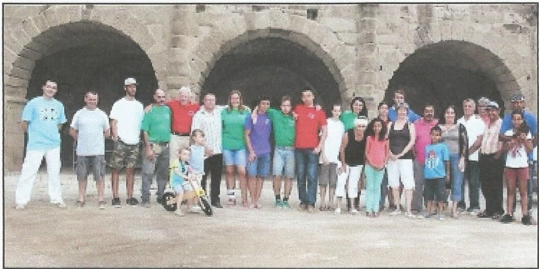
Le groupe de jeunes était accompagné du maire, Bernard Brottes et l'adjointe, Mireille Mousard.

Ce séjour est, pour ces jeunes, l'occasion de découvrir la ville et la région, mais aussi, pour les habitants, de participer à des échanges autour d'un moment convivial.