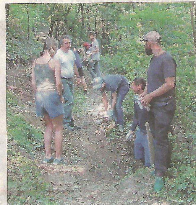
Le chantier est assuré par des jeunes venus du monde entier.